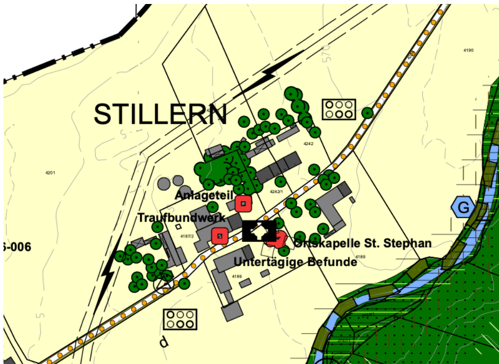
Ausschnitt aus dem rechtswirksamen FNP